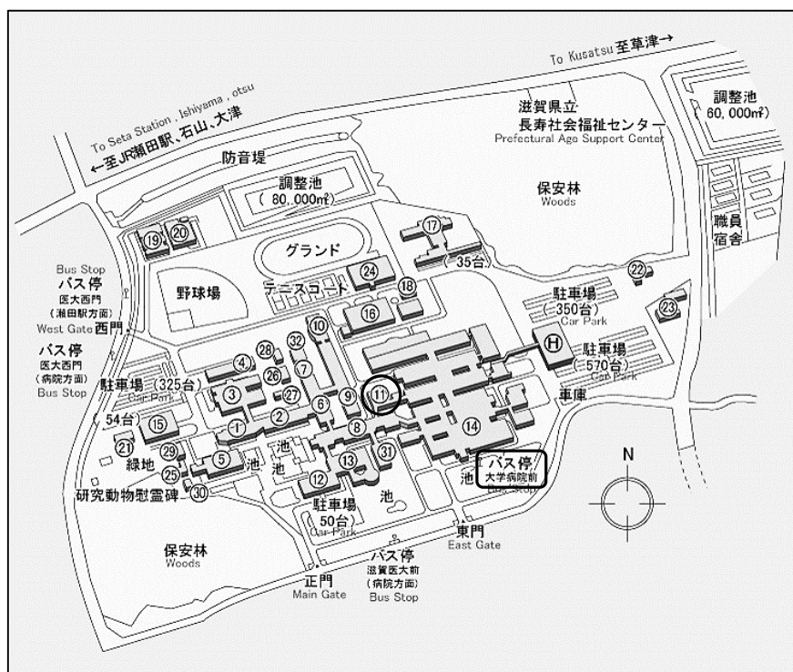
上記地図の⑩が臨床講義棟です