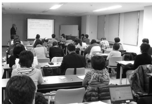
研修セミナーの風景