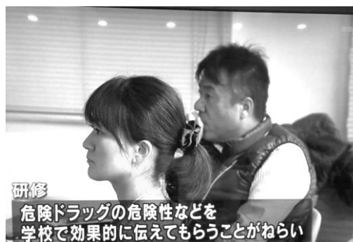
当日夕刻のニュースでも紹介されました